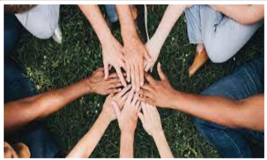
Klub Nord modtager børn fra 9 forskellige skoler- vi samarbejder med alle skoler.