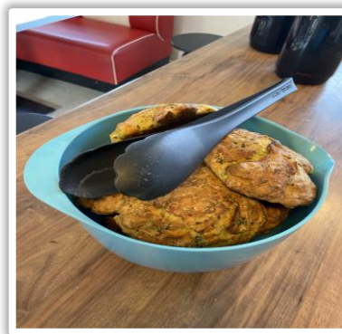
Hver eftermiddag serveres eftermiddagssnack- for at minske sulten inden aftenmsamden.